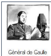
Général de Gaulle

1) Relie chaque mot en bleu à la bonne personne et à la bonne définition