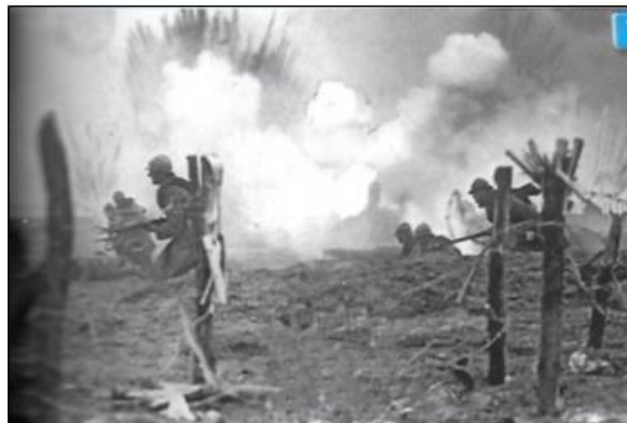
L'enfer de Verdun, extrait du manuel Histoire- Géographie CM2 édition Nathan